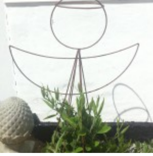
Engel, 230 kr