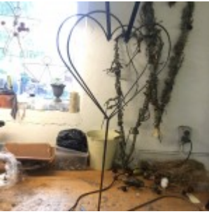
Det rå hjerte