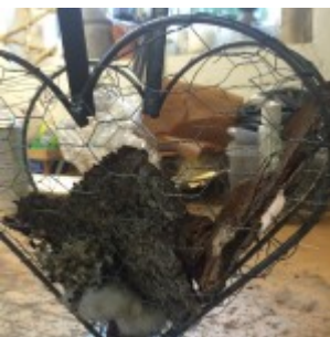
Så beklædes de to hjerter indvendigt med bark mv. Herefter lægges et stykke fedtpapir eller pose, som fyldes med jord – hvor der plantes i. Dekorér