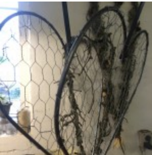
Først sættes bukkens hønsenettet rundt om de to hjerter.